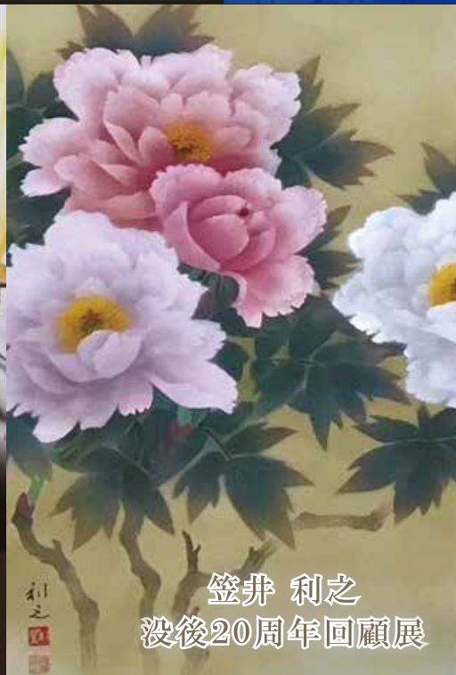
笠井 利之 没後20周年回顧展