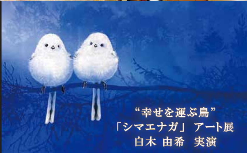
“幸せを運ぶ鳥” 「シマエナガ」アート展 白木 由希 実演